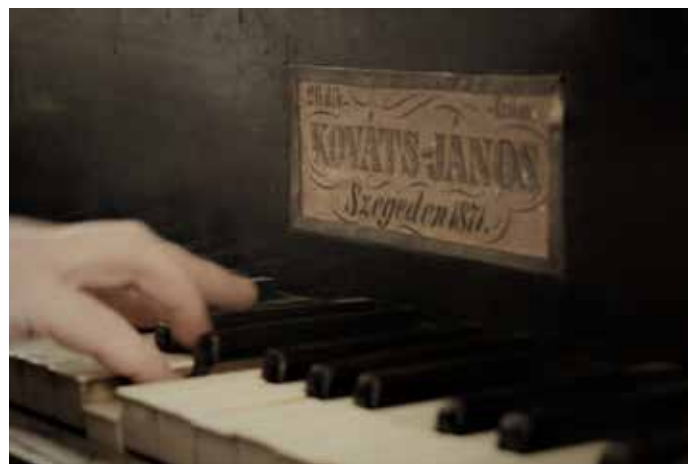
... és választott szolgálati hangszere, az 1871-ben Szegeden készült, Kováts János-féle, 26-os számú orgona

-A megkezdett munka folytatásának nincs és nem is lehet alternatívája, bármekkora időintervallumban gondolkodjunk. Eddigi munkavégzésem során gyakran tapasztalhattam, hogy bár nagyon sok minden olyan hurrá!, kitörő optimizmussal indult, egy bizonyos pont után... Nem, nem újkeletű jelenség ez, mégis lehangoló. Ilyenkor elcsüggedek. Meg egyre sorjázó kérdésekkel ostromozom magam, kinek-minek csinálom még mindezt? Istennek hála, idővel – a realitás talaján maradván, megkapom a választ is. Tőle. Az Úrtól. Azért, és csakis azért, hogy ne haljon el az énekszó.