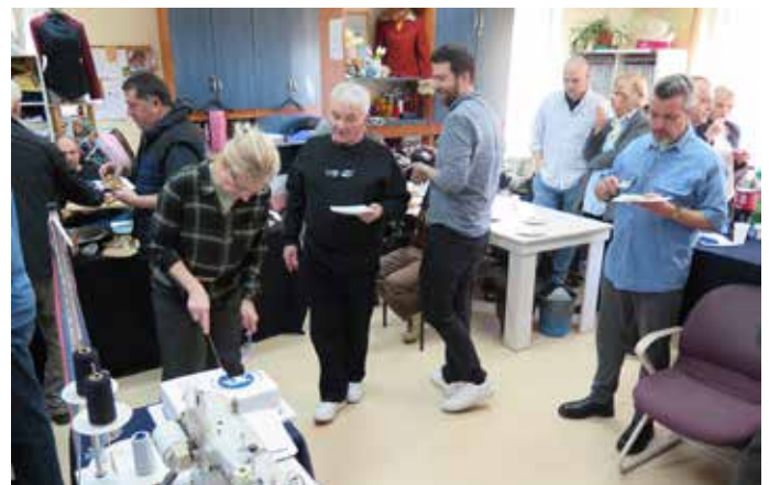
Az ünnepi torta megszegése